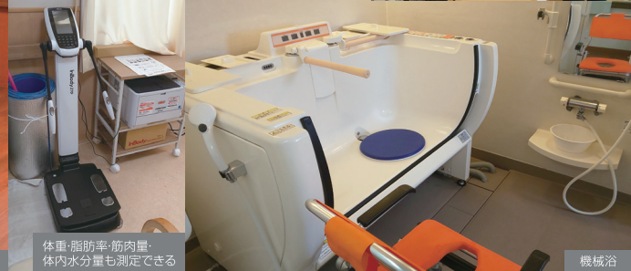
体重・脂肪率・筋内量・体内水分量も測定できる