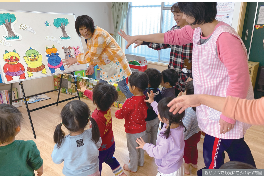
親がいつでも見にこられる保育園

現在、特別養護老人ホームやデイサービスをはじめ、多方面から介護・福祉事業を展開しています。全てに通ずる理念は「やさしさとおもいやり」。職員一人ひとりがご利用者に寄り添える温かな介護を目指しています。