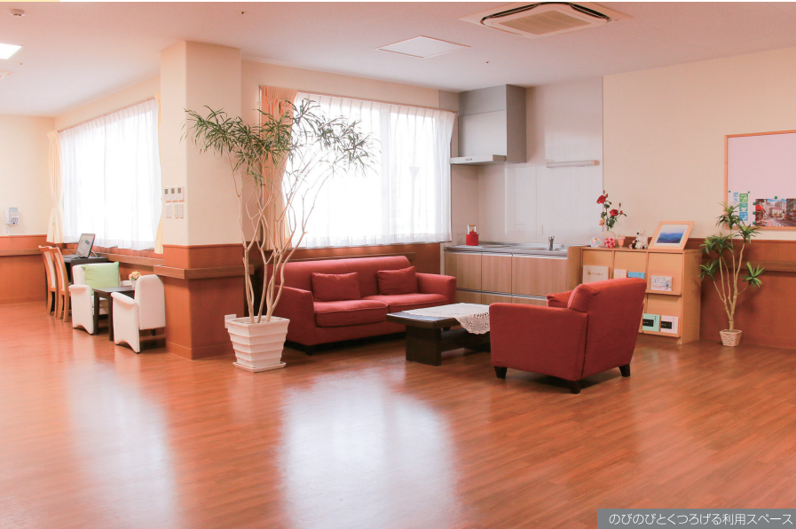
のびのびとくつろげる利用スペース

私たちは「利用される方、サービスを提供する職員、利用者様ご家族、関わるすべての人が笑顔でいられるように」をモットーに、常にそのための知識や技術を学びながら、新しい福祉の形に挑戦しています。