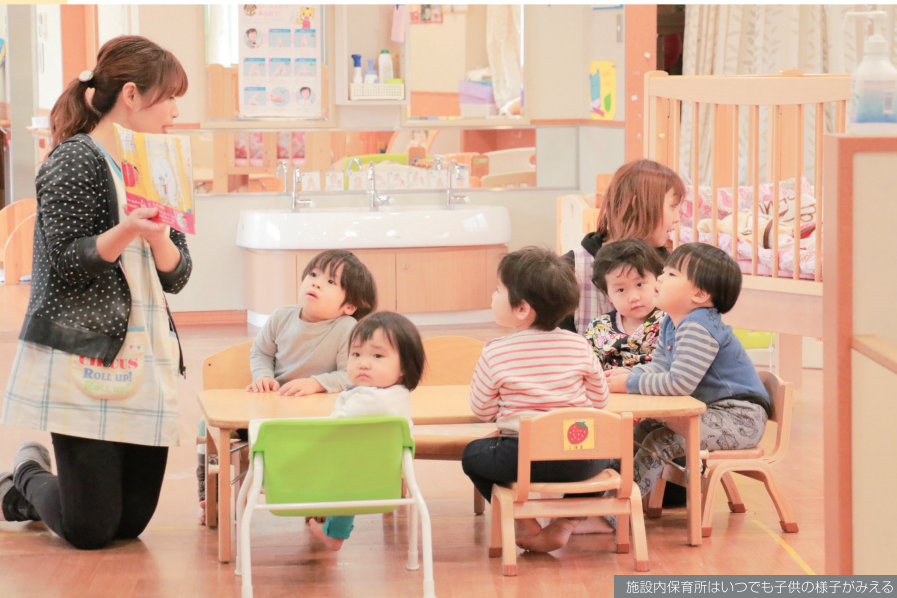
施設内保育所はいつでも子供の様子がみえる

地域の特色・文化を尊重し、地域で求められることに耳を傾けることが社会福祉法人の使命と考え、福祉だけでなく医療保険や教育の分野とも連携することが重要と考え、あらゆる角度から問題解決に取り組んでいます。