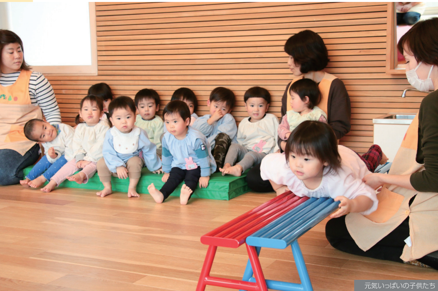
元気いっぱいの子供たち

ハーネス加工、板金加工、電気・制御機器の組立等、完成品までの一貫生産が当社の強み。オートメーション化できない熟練した技能と経験を誇りに「つくる喜びと感動」「打つ手は無限」を掲げ今後もトライし続けます。