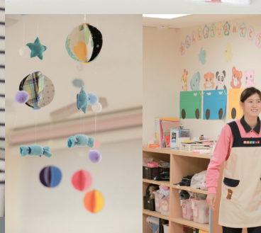
ニチイキッズは0歳～1歳児が対象