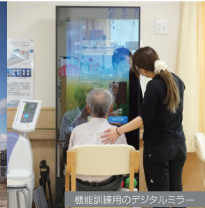
機能訓練用のデジタルミラー